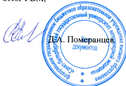
Д.А. Померанцев Документов