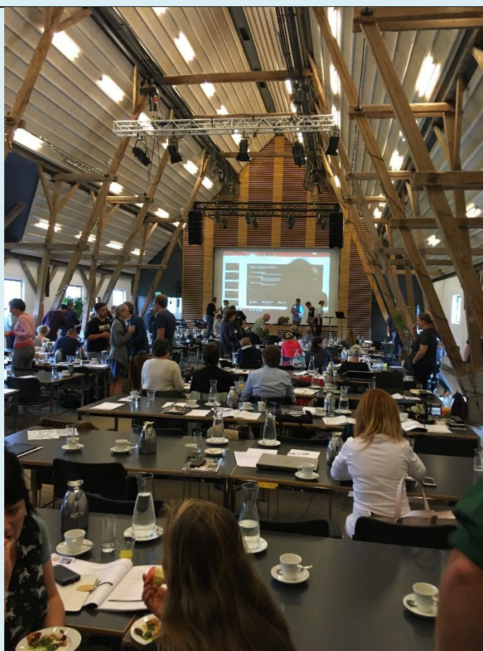
Конференц-зал. Научная сессия