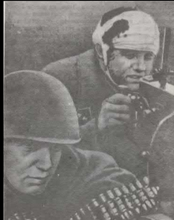
Пулеметчики на Пулковской высоте

6 октября Г.К. Жуков доложил Ставке Верховного Главного командования: фашисты под Ленинградом понесли большие потери и перешли к обороне.