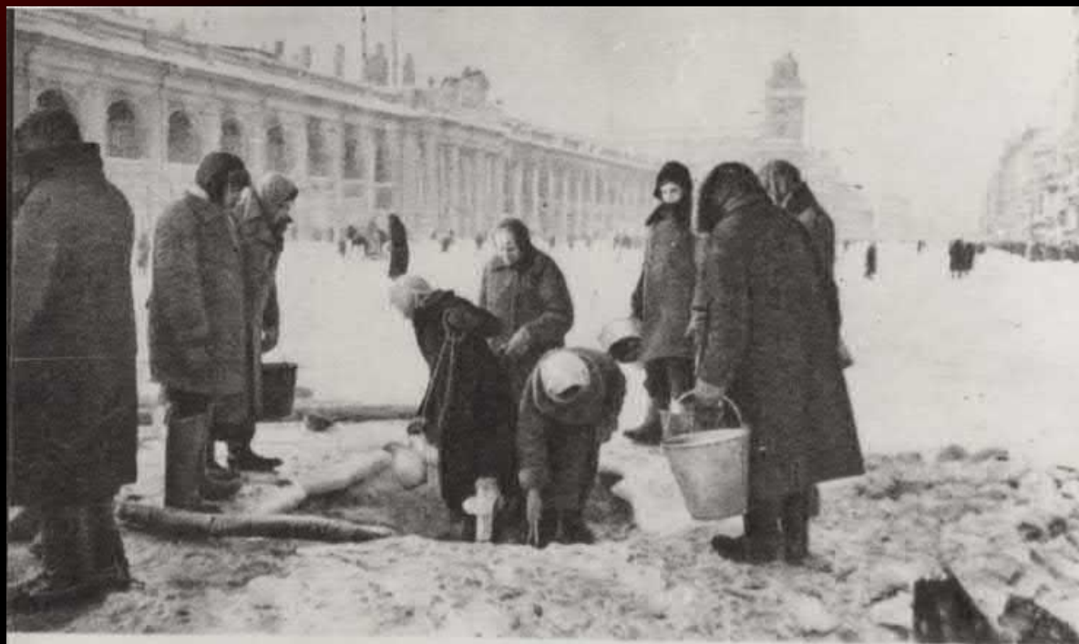
За водой на Невский