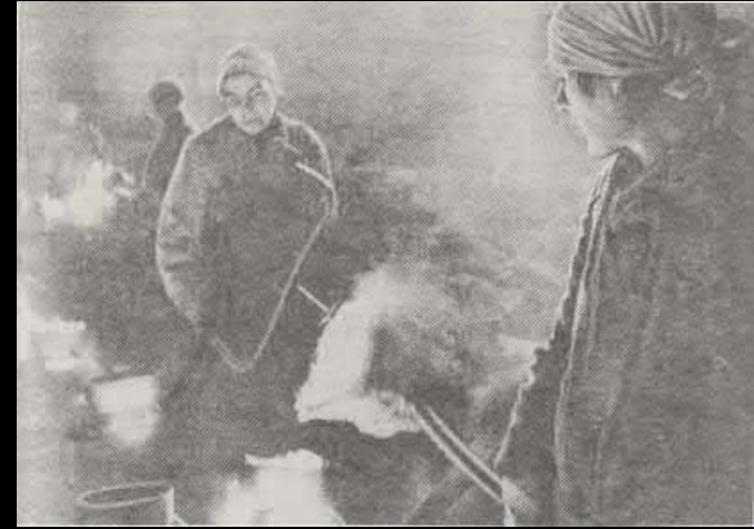
Литейный цех завода в блокадном городе. Женщины заменили мужчин.