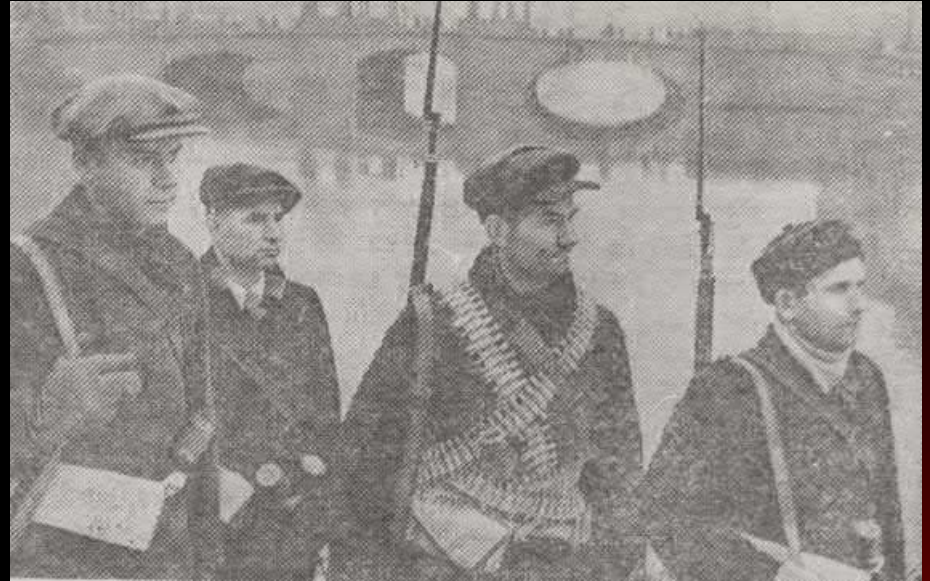
Добровольцы Адмиралтейского района

Общая численность военных формирований – 200 тысяч ленинградцев. 10 июля – создано Главное Командование Северо-Западного направления под командованием К.Е. Ворошилова, А.А. Жданова и М.В. Захарова.