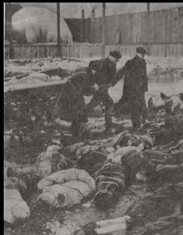
Умершие от голода

Сожжено 3174 здания, повреждено – 7134 здания, уничтожено 5 миллионов квадратных метров площади.