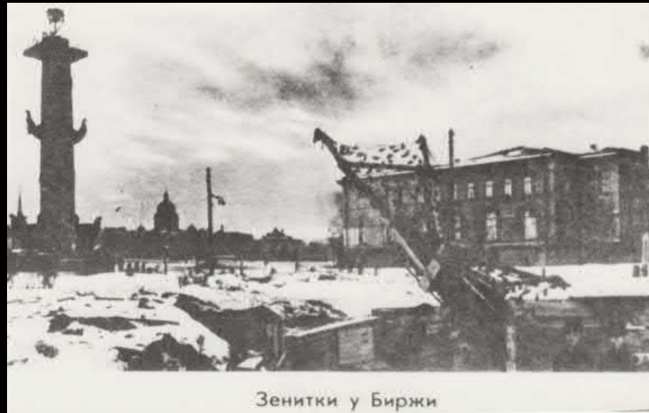
Зенитки у Биржи

В командование фронтом вступил генерал-майор И.И. Федюнинский. Началось беспримерное в истории противостояние. Гитлеровская группа армии «Север» в составе 30 дивизий остановилась, охватив 200-километровым кольцом непокоренный город.