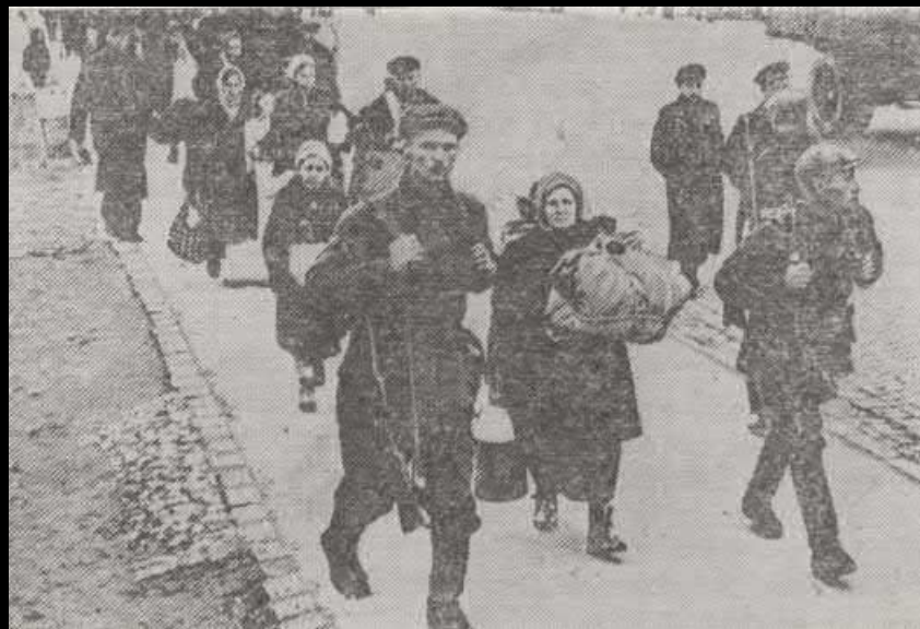
Сентябрь 1941 года. Население покидает Кировский район, ставший передним краем обороны

27 июня 1941 года вышло Постановление ЦК партии и Советского правительства об эвакуации людей и промышленного оборудования из прифронтовых городов.