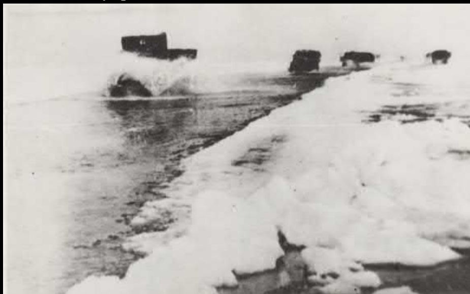
На Ладоге весной.

22 ноября 1941 года начала действовать ледовая трасса, «Дорога жизни». На ней трудилось свыше 19 тысяч человек – водители, рабочие, бойцы. К началу декабря на «Дороге жизни» курсировало непрерывно 3400 машин. За две блокадные зимы до марта 1943 года в город было доставлено 1 миллион 615 тысяч тонн грузов. Эвакуировано 1 миллион 376 тысяч человек.