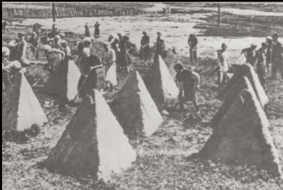
Противотанковые надолбы у стен города

13 сентября командование Ленинградским фронтом принял генерал армии Г.К. Жуков.