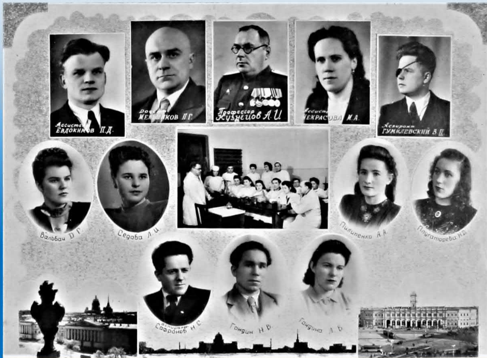
Основной состав кафедры в 1950-м году (и немного студентов-выпускников)