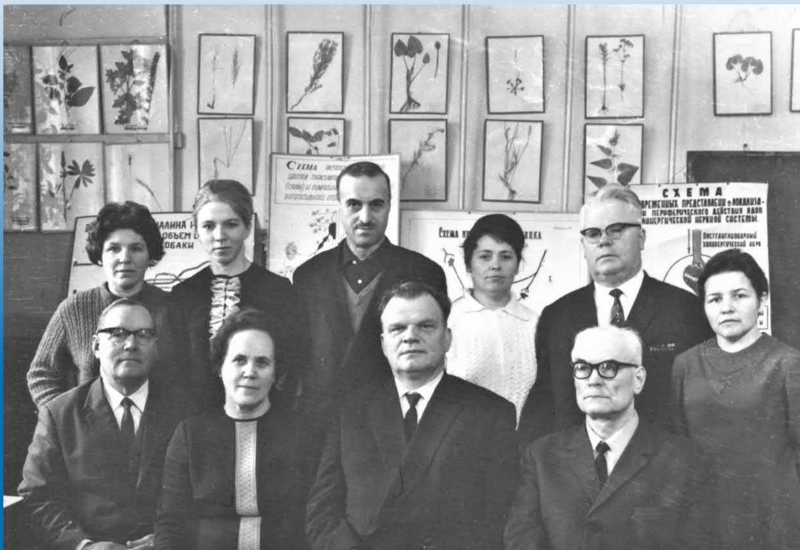
КОЛЛЕКТИВ КАФЕДРЫ В 1978 ГОДУ