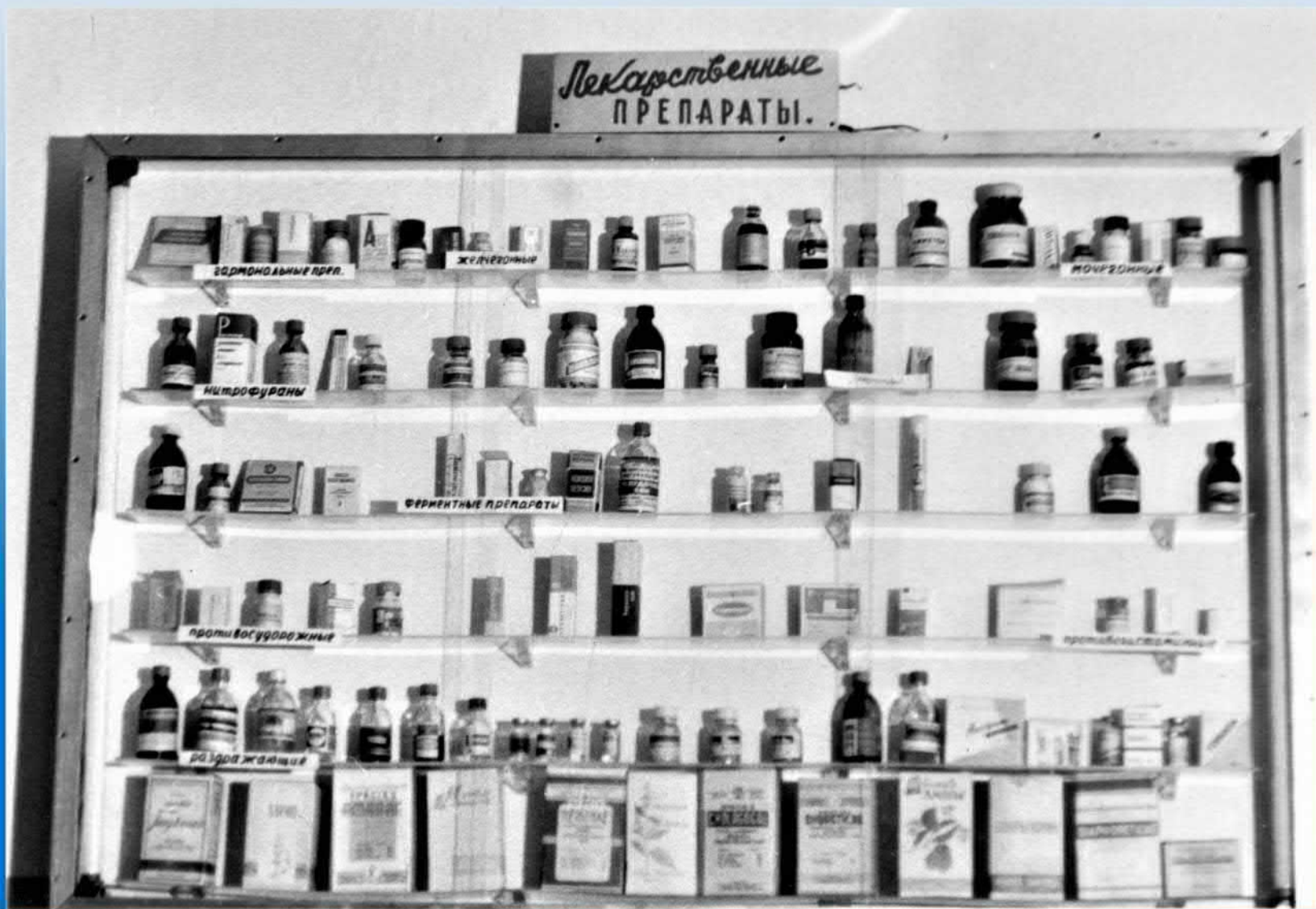
Учебное пособие по фармакологии в аудитории кафедры