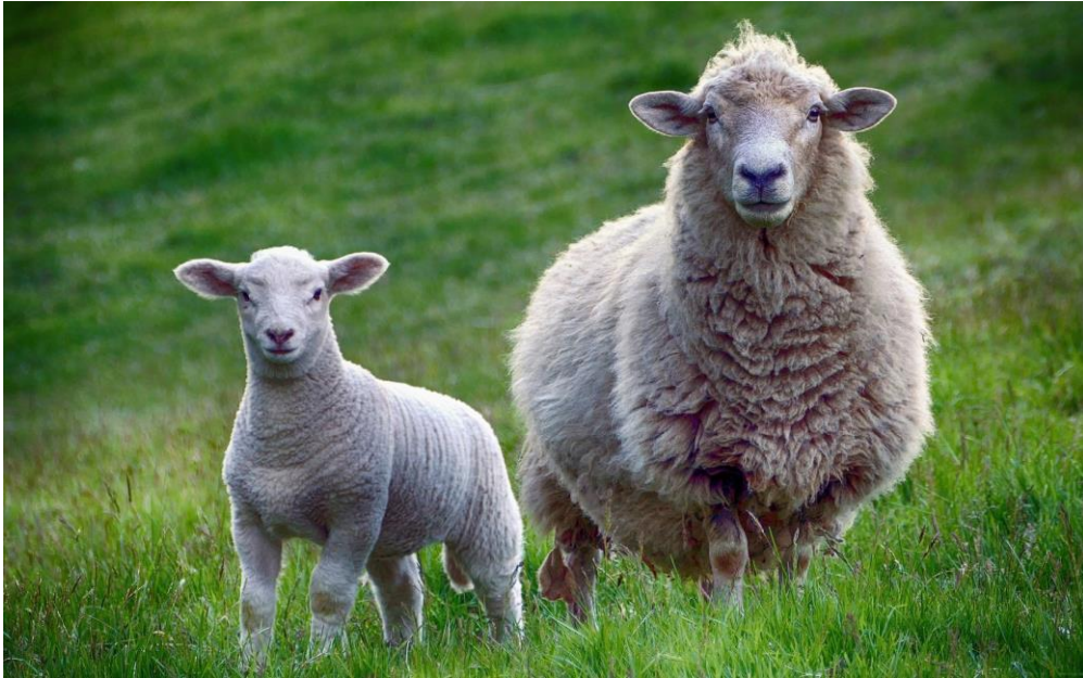
Рисунок 1 – Пастбищное содержание овец.